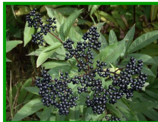
Кустарник Бузина черная