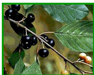
Кустарник Крушина ломкая